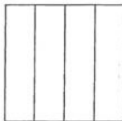
Сл. уз зад. 4